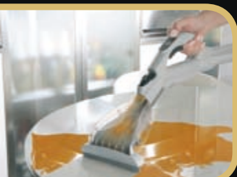
Odkurzenie z użyciem filtra wodnego