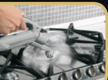
Dezynfekcja za pomocą pary wodnej