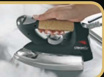
Profesjonalne prasowanie tradycyjne lub z użyciem pary wodnej