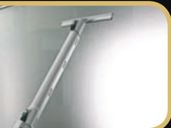
Czyszczenie i odkurzenie przy pomocy pary wodnej