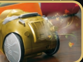
Oczyszczanie powietrza i aromaterapia